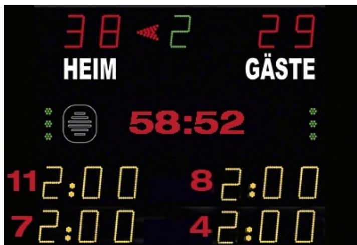
Abbildung 1: Beispiel Anzeigetafel

Das Anzeige-System in der Spielstätte muss eine öffentliche Zeitmessanlage sein, die von allen Zuschauerplätzen und insbesondere vom Zeitnehmertisch ohne Einschränkungen eingesehen werden kann. Werden auf der Anzeigetafel Zeitstrafen angezeigt, so müssen mindestens zwei Hinausstellungen pro Verein inkl. Spielernummer und Strafzeit (siehe Abbildung 1) angezeigt werden können. Sollte dies nicht möglich sein, so ist bei Hinausstellungen die Zeit des Wiedereintritts inkl. Spielernummer jeweils auf einem Vordruck in Papierform einzutragen und sichtbar anzubringen.