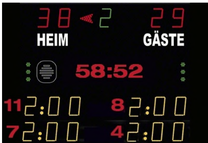
Abbildung 1: Beispiel Anzeigetafel

Das Anzeige-System in der Spielstätte muss eine öffentliche Zeitmessenanlage sein, die von allen Zuschauerplätzen und insbesondere vom Zeitnehmertisch ohne Einschränkungen eingesehen werden kann. Werden auf der Anzeigetafel Zeitstrafen angezeigt, so müssen mindestens zwei Hinausstellungen pro Verein inkl. Spielernummer und Strafzeit (siehe Abbildung 1) angezeigt werden können. Sollte dies nicht möglich sein, so ist bei Hinausstellungen die Zeit des Wiedereintritts inkl. Spielernummer jeweils auf einem Vordruck in Papierform einzutragen und sichtbar anzubringen.