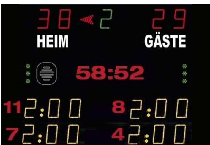
Abbildung 1: Beispiel Anzeigetafel

Das Anzeige-System in der Spielstätte muss eine öffentliche Zeitmessanlage sein, die von den Zuschauerplätzen und insbesondere vom Zeitnehmertisch ohne Einschränkungen eingesehen werden kann. Werden auf der Anzeigetafel Zeitstrafen angezeigt, so müssen mindestens zwei Hinausstellungen pro Verein inkl. Spielernummer und Strafzeit (siehe Abbildung 1) angezeigt werden können. Sollte dies nicht möglich sein, so ist bei Hinausstellungen die Zeit des Wiedereintritts inkl. Spielernummer jeweils auf einem Vordruck in Papierform einzutragen und sichtbar anzubringen.