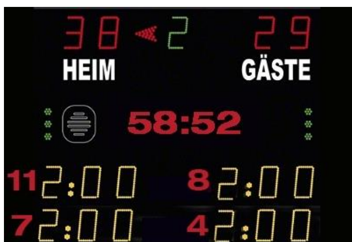
Abbildung 1: Beispiel Anzeigetafel

Das Anzeige-System in der Spielstätte muss eine öffentliche Zeitmessanlage sein, die von den Zuschauerplätzen und insbesondere vom Zeitnehmertisch ohne Einschränkungen eingesehen werden kann. Werden auf der Anzeigetafel Zeitstrafen angezeigt, so müssen mindestens zwei Hinausstellungen pro Verein inkl. Spielernummer und Strafzeit (siehe Abbildung 1) angezeigt werden können. Sollte dies nicht möglich sein, so ist bei Hinausstellungen die Zeit des Wiedereintritts inkl. Spielernummer jeweils auf einem Vordruck in Papierform einzutragen und sichtbar anzubringen.