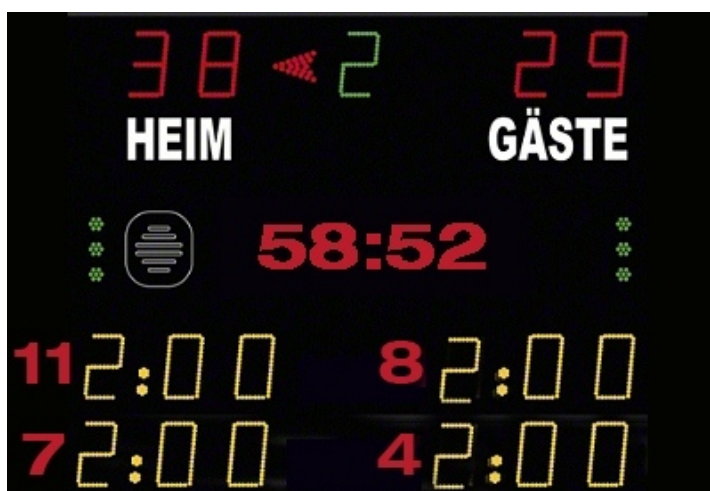
Abbildung 1: Beispiel Anzeigetafel

Das Anzeige-System in der Spielstätte muss eine öffentliche Zeitmessanlage sein, die von den Zuschauerplätzen und insbesondere vom Zeitnehmertisch ohne Einschränkungen eingesehen werden kann. Werden auf der Anzeigetafel Zeitstrafen angezeigt, so müssen mindestens zwei Hinausstellungen pro Verein inkl. Spielernummer und Strafzeit (siehe Abbildung 1) angezeigt werden können. Sollte dies nicht möglich sein, so ist bei Hinausstellungen die Zeit des Wiedereintritts inkl. Spielernummer jeweils auf einem Vordruck in Papierform einzutragen und sichtbar anzubringen.