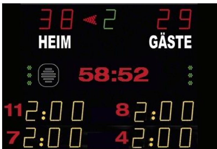
Abbildung 1: Beispiel Anzeigetafel

Das Anzeige-System in der Spielstätte muss eine öffentliche Zeitmessanlage sein, die von den Zuschauerplätzen und insbesondere vom Zeitnehmertisch ohne Einschränkungen eingesehen werden kann. Werden auf der Anzeigetafel Zeitstrafen angezeigt, so müssen mindestens zwei Hinausstellungen pro Verein inkl. Spielernummer und Strafzeit (siehe Abbildung 1) angezeigt werden können. Sollte dies nicht möglich sein, so ist bei Hinausstellungen die Zeit des Wiedereintritts inkl. Spielernummer jeweils auf einem Vordruck in Papierform einzutragen und sichtbar anzubringen.