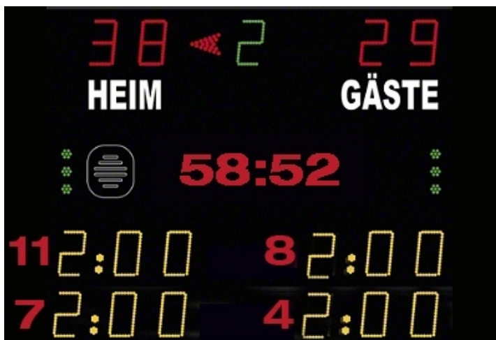
Abbildung 1: Beispiel Anzeigetafel

Das Anzeige-System in der Spielstätte muss eine öffentliche Zeitmessanlage sein, die von den Zuschauerplätzen und insbesondere vom Zeitnehmertisch ohne Einschränkungen eingesehen werden kann. Werden auf der Anzeigetafel Zeitstrafen angezeigt, so müssen mindestens zwei Hinausstellungen pro Verein inkl. Spielernummer und Strafzeit (siehe Abbildung 1) angezeigt werden können. Sollte dies nicht möglich sein, so ist bei Hinausstellungen die Zeit des Wiedereintritts inkl. Spielernummer jeweils auf einem Vordruck in Papierform einzutragen und sichtbar anzubringen.